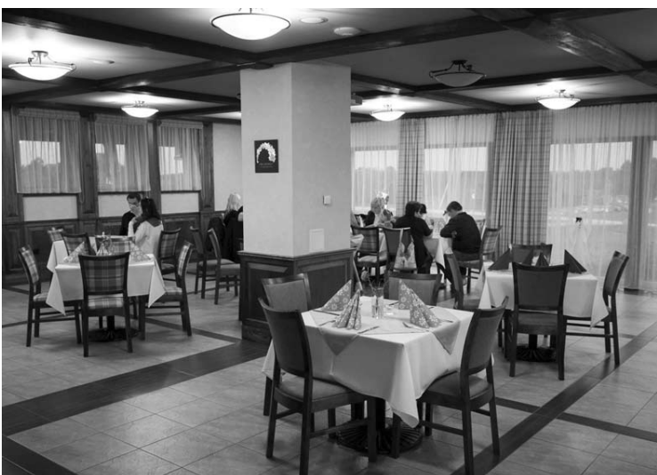
Restorane galima suruošti šventę 60 žmonių.