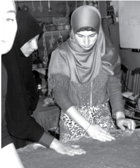
Būsimosios Pankisio slėnio verslininkės - jos mokosi velti vilną.

vaizdu, kad Pankisio slėnis įdomus daugelio šalių žurnalistams. Mergaitės, apmūturios skaromis, taip, kad neišvelgsi, kokia jų figūra nei amžius, stengėsi nekalbėti. Prie nežinia ar veikiančio kompiuterio (kažkokia įtartina lentelė švietė ant ekrano) sėdėjo ir keletas 8-10 metų berniukų. Matyt, tokio amžiaus jaunuoliai gali drąsiai lankytis patalpose, kur esama merginų.