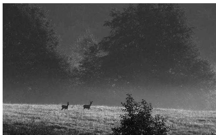
Kartais iš rūko išbėga stirnos...