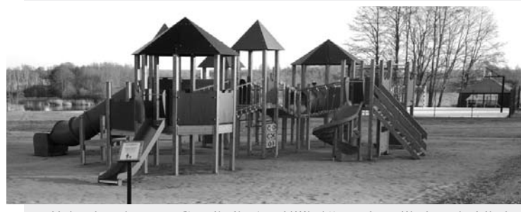
Poilsiaujantiems „Gradiali Anykščiai“ - krepšinio, tinklinio, vaikų žaidimų aikštelės.