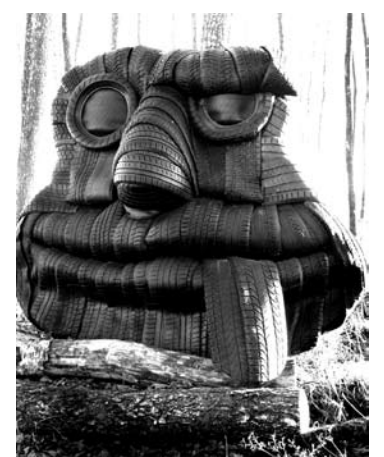
Kaukių miško gyventojai Spalvinis ir Padanginis.