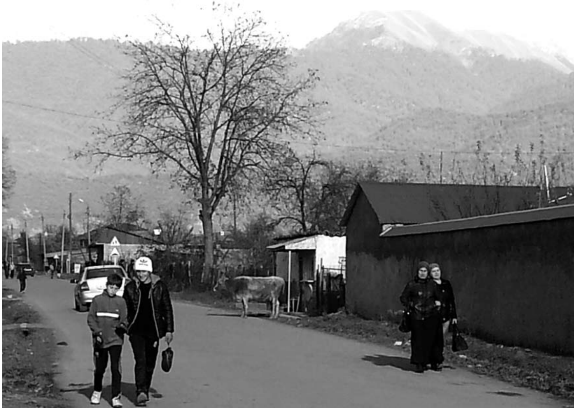
Pankisio slėnis - vidutiniškai 5 kilometrų pločio ir 28 kilometrų ilgio tarpekis Kaukazo kalnuose. Gyvenviečių gatvėse išsitenka ir pėstieji, ir karvės, ir automobiliai.

Lapkričio pabaigoje mes, keturi Lietuvos žurnalistai, lankėmės Gruzijoje. Studijų vizito tikslas – susipažinti su projektais, kuriuos LR Užsienio reikalų ministerija įgyvendina šioje šalyje Vystomojo bendradarbiavimo ir paramos demokratijai lėšomis.