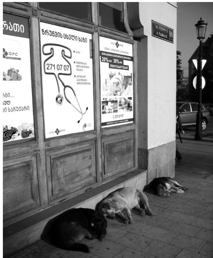
Šunys, katės Gruzijos sostinėje Tbilisyje niekam nekliudo. Šunys tylūs, neagresyvūs. Kiekvieną rytą šie trys bičiuliai gulėdavo prie viešbučio.