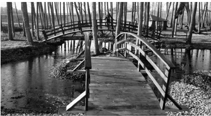
Kaukių miške – tvenkinėliai ir tilteliai.

Sumanymų turime ir ateičiai, galėsime džiuginti ne tik muzikiniai vakarais ar šeimų popietėmis savaitgaliais, tačiau taip pat organizuosime ir įvairius renginius, į kuriuos būtinai ir Jus pakviesime.