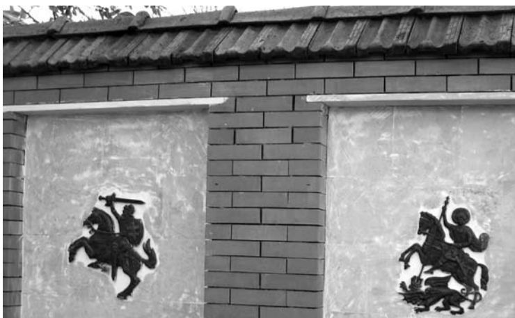
Ant Chašurio bibliotekos tvoros - Lietuvos ir Gruzijos herbai.